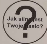
Rysunek 1. Grafika

Witryna internetowa wykorzystuje grafikę, którą należy przygotować i jest ona zgodna z rysunkiem 1.